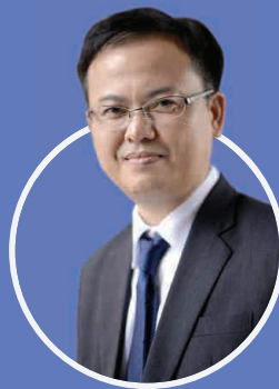
ดร.กิตติพงศ์ พร้อมวงศ์ ผอ.สอวช.